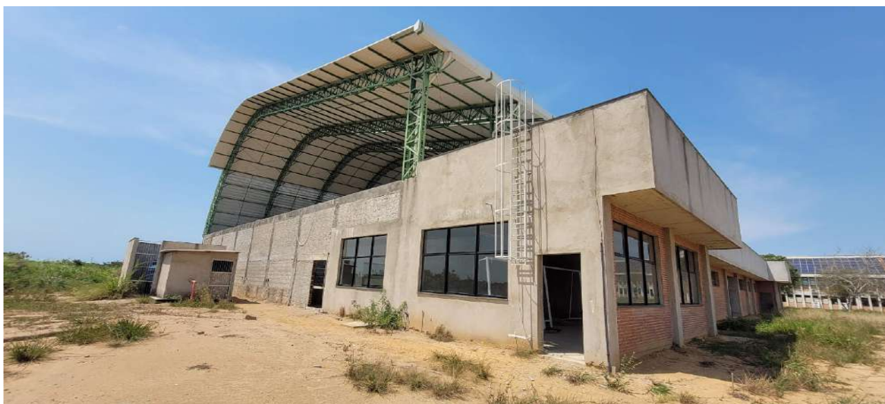
Fig 06 – Visão da Lateral Esquerda Externo/Casa de Bombas