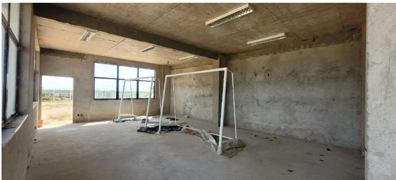
Fig 05 – Visão da Sala de Ginástica

Ministério da Educação Instituto Federal do Espírito Santo Campus Serra