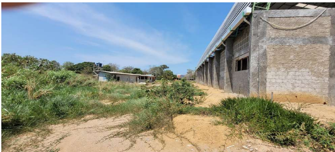
Fig 07 – Visão do Fundo Externo

Ministério da Educação Instituto Federal do Espírito Santo Campus Serra