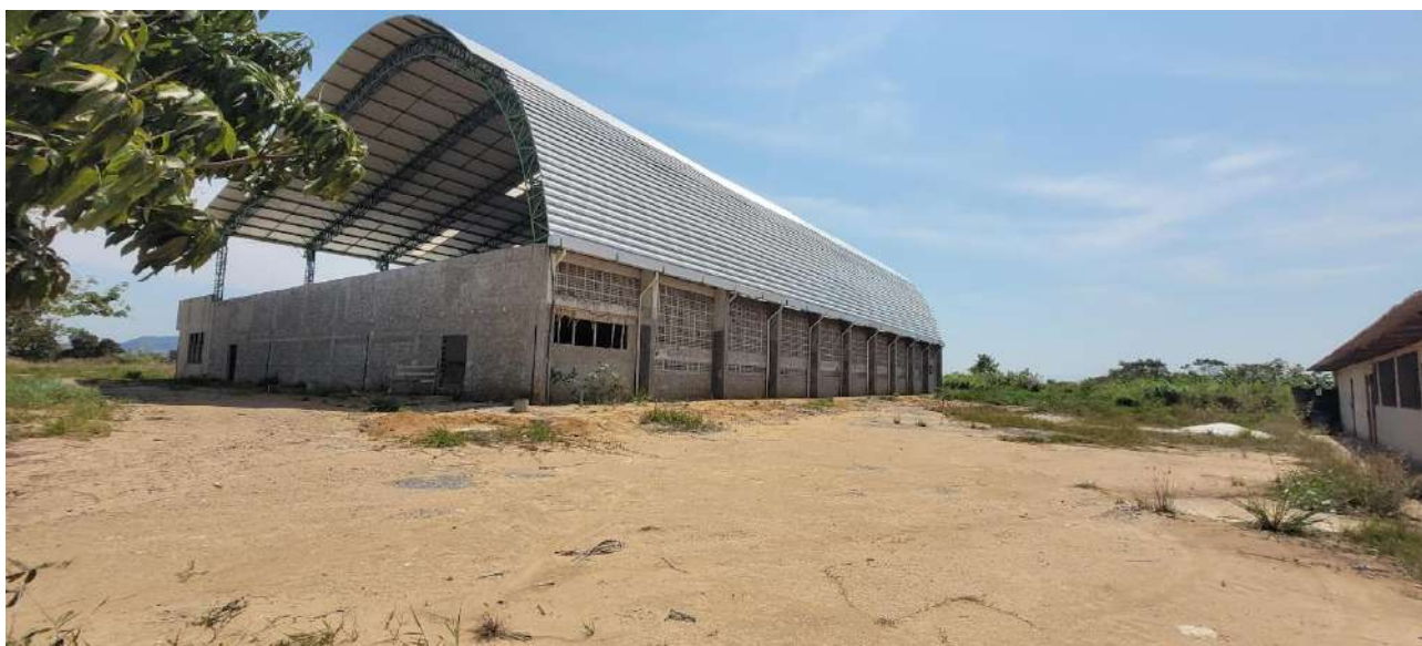
Fig 09 – Visão da Lateral Direita Externa e Fundo

Ministério da Educação Instituto Federal do Espírito Santo Campus Serra