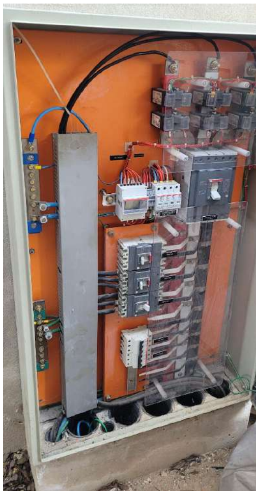
Fig 12 – QGBT