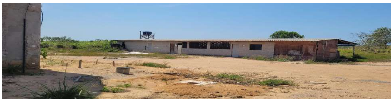
Fig 11 – Visão do Barracão de Obra