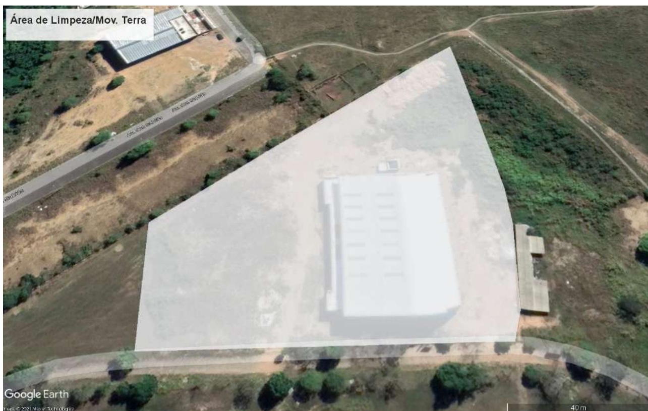
Fig 18 – Área da Limpeza/Movimento de Terra à ser feita na execução