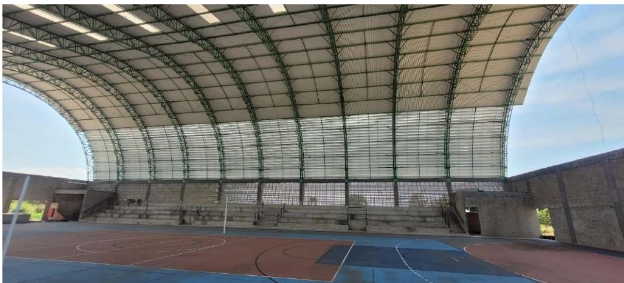
Fig . 02 – Visão do Fundo Interna do Ginásio