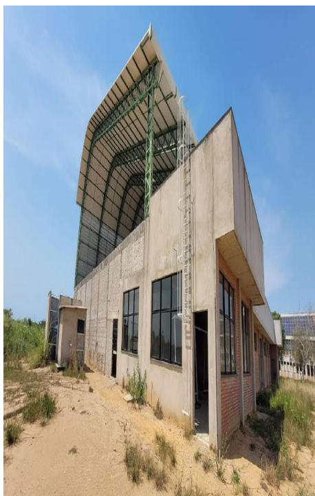
Fig 19 – Complemento de Veneziana no telhado - Modelo Venezianas já instaladas.