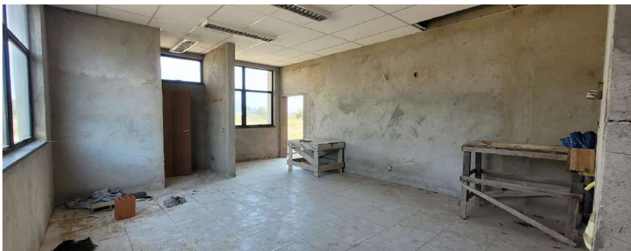
Fig 04 – Visão da Sala de Professores do Ginásio