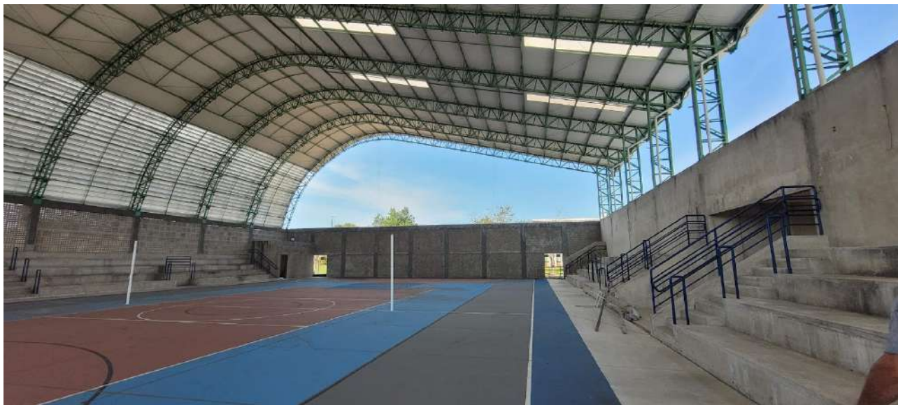
Fig . 01 – Visão da Lateral Direita Interna do Ginásio