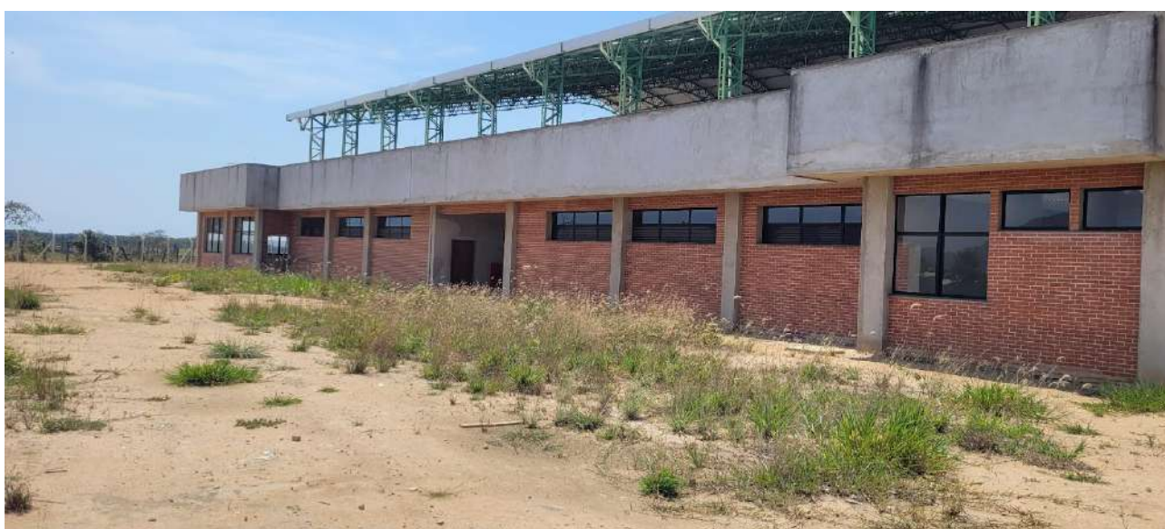
Fig 08 – Visão da Frente do Ginásio