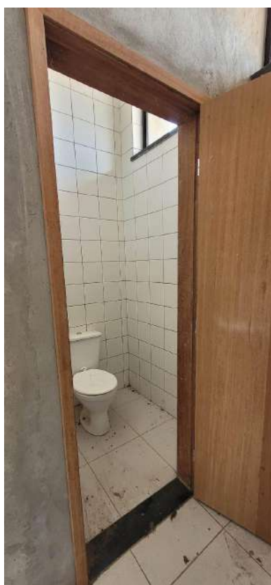
Fig 14 – Banheiro Sala Professores