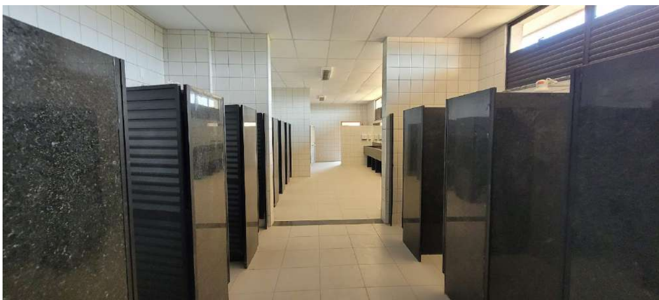
Fig 10 – Visão do Banheiro