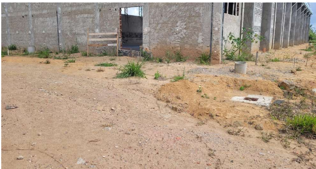
Fig 16 – Exemplo de caixas a serem niveladas na pavimentação.