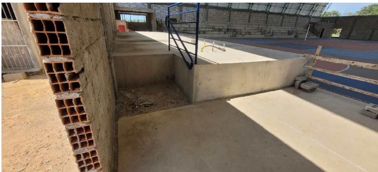
Fig 15 – Visão palco escada.

Ministério da Educação Instituto Federal do Espírito Santo Campus Serra