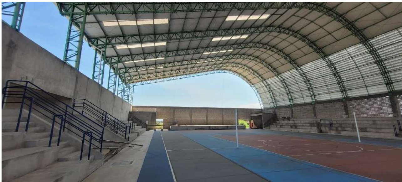
Fig 03 – Visão da Lateral Esquerda Interna do Ginásio

Ministério da Educação Instituto Federal do Espírito Santo Campus Serra