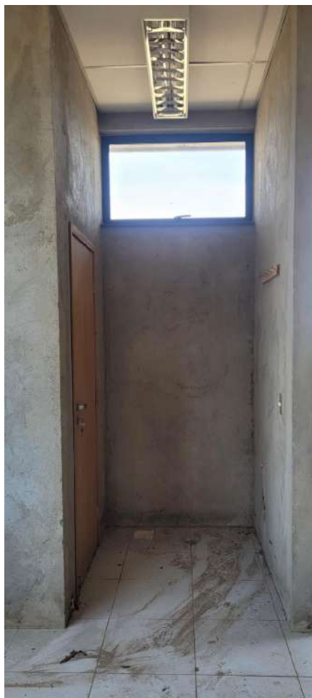
Fig 13 – Lavabo Sala Professores